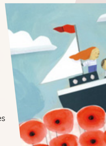
Visuel de l'affiche 2019 réalisé par Barroux

Les rencontres auteurs (notamment auprès des plus jeunes, dans toutes les écoles du territoire), les animations (contes, exposition, ateliers...) et les traditionnelles dédicaces seront complétées par une balade au pays des jeux. Et des jeux sous toutes leurs formes : jeux de société, sur console, ou encore jeux picards à venir découvrir et tester en famille. À cette occasion sera lancé un projet de conception d'un jeu vidéo sur le Pays du Coquelicot, mené par un collectif d'artistes en résidence. Une collecte sera d'ailleurs lancée sur ces deux jours pour nourrir cette création de vos témoignages, de vos souvenirs et de l'histoire de vos villages.