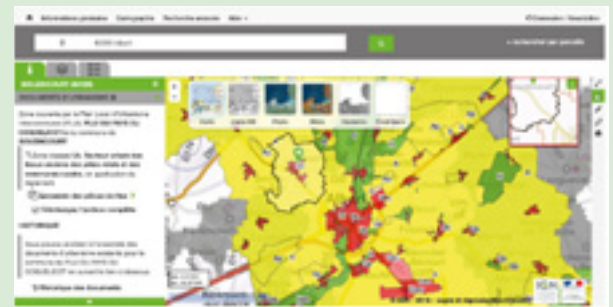
Le portail geoportail-urbanisme.gouv.fr permet d'obtenir toutes les informations utiles concernant toutes les parcelles du Pays du Coquelicot.

Pour les habitants, rien ne change. La demande de permis de construire doit toujours être déposée en mairie. Et après étude, l'acte est également signé par le maire. Seules les coulisses changent. Désormais, ce ne sont plus les services de l'État qui instruisent les dossiers mais la Communauté de communes. Sa mission consiste à vérifier que le dossier est en adéquation avec le règlement du plan local d'urbanisme intercommunal.