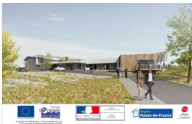
Le futur Hébergement innovant d'entreprises

Le pilotage des projets est confié à la Région. Elle aura la charge, en liaison avec le territoire et les industriels, de présenter ses priorités (accès au numérique, besoin en foncier, renforcement des formations professionnelles, accompagnement de l'innovation, friches...).