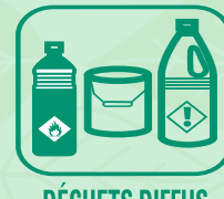
DÉCHETS DIFFUS SPECIFIQUES (DDS)