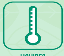
LIQUIDES DE REFROIDISSEMENT