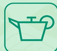
HUILES DE VIDANGE