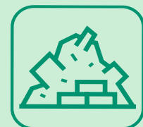
DÉBLAIS / GRAVATS