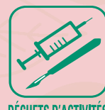
DÉCHETS D'ACTIVITÉS DE SOINS À RISQUES