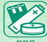
PILES ET ACCUMULATEURS