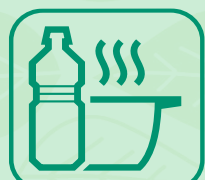
HUILES DE FRITURES