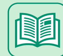
JOURNAUX / REVUES