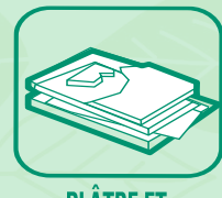
PLÂTRE ET PLAQUES DE PLÂTRE