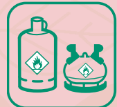
BOUTEILLES DE GAZ

à déposer chez votre revendeur ou dans un garage